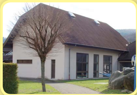
Isolation de la salle des sports de l'école Geiler