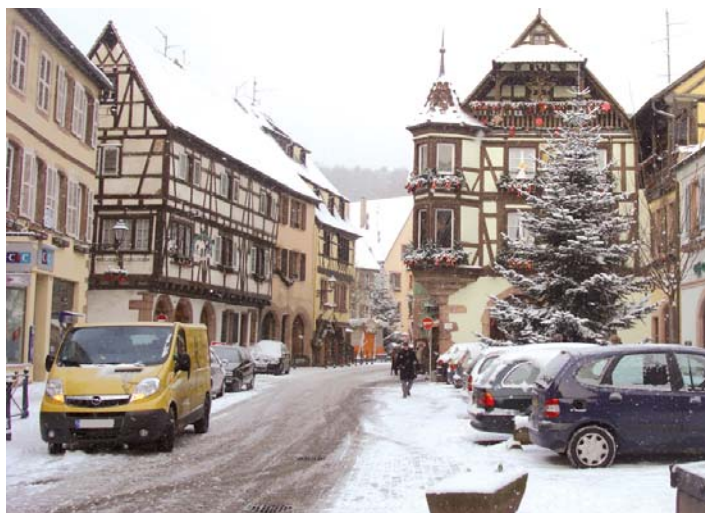
L'accès aux commerces est assuré.

Cette glace a mis 8 jours à disparaître du fait du froid intense accompagné de pluies verglaçantes.