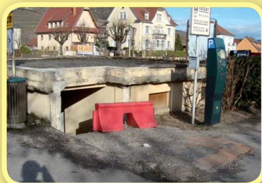
Étude pour la réhabilitation des toilettes publiques de la Porte Basse