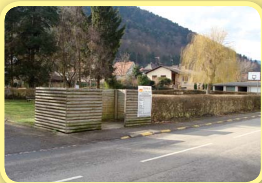
Logements pour personnes à mobilité réduite