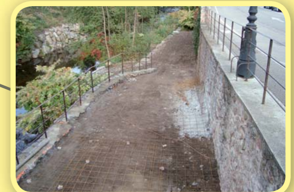
Aménagement des berges de la Weiss