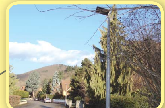
Remplacement des luminaires