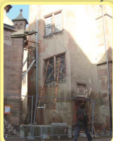
Consolidation de la tourelle de la mairie