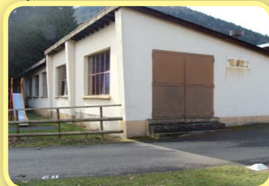
Étude pour la rénovation du quiller