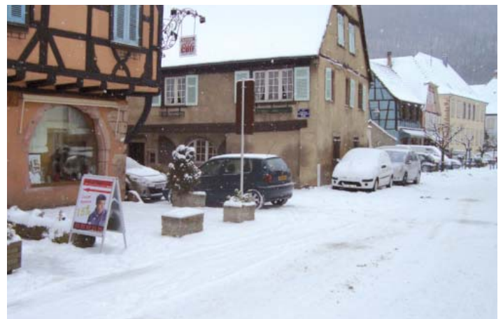
Balayons devant notre porte.

Nous rappelons qu'en Allemagne les pneus neige sont obligatoires en période hivernale.