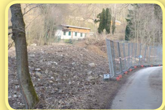
Renaturation du Vallon du Toggenbach